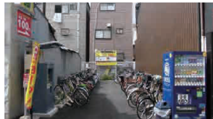
狭小地をコイン駐輪場 として有効活用