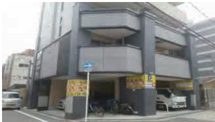
マンション駐車場の空き スペースを有効活用