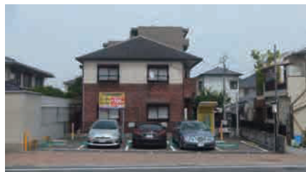
家の庭の一部をコイン パーキングとして有効活用